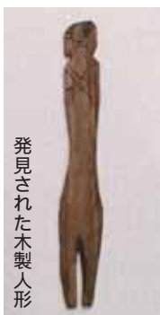
発見された木製人形

寒川においても「木製人形」が出土していることから、古くより官庁がこの地にも存在し、神事が齋行されていたと考えられます。現在も神宮をはじめ、全国津々浦々の神社で水無月・