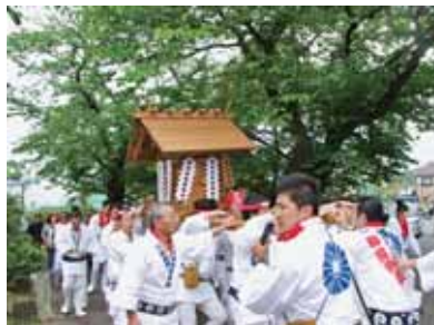
神揃山へ向う神輿

一之宮を主張、比々多神社より「いすれ明年まで」と仲裁され、例年にならい決着が来年に持ち越されました。 その後、祭場を大矢場に移し、総社である六所神社と五社との間で神対面の儀、国司奉幣の儀等の祭典が行