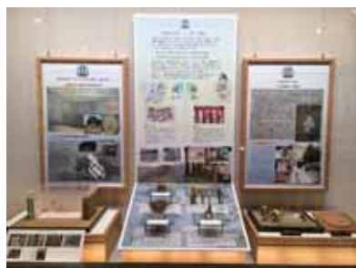
人形をはじめ墨書人面土器土馬等を展示