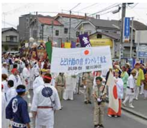
横幕を掲げてのパレード