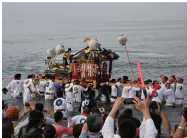
▶ 浜にて禊をする神輿

湘南の夏の風物詩として親しまれている この浜降祭は、寒川神社をはじめ寒川町と 茅ヶ崎市に鎮座する三十四社三十九基の神