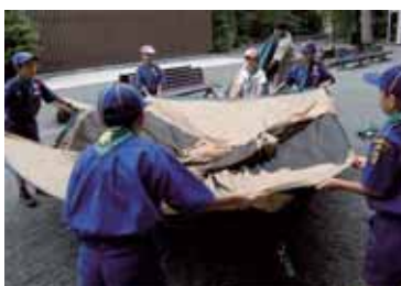
ドームテント設営風景