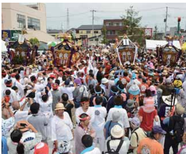
町内四社揃い踏み

本年は、被災地の神輿会の方々も菅谷神社の神輿を担がれており、玉串を神々に捧げ早期復興が誓われました。会場では、寒川神輿まつり実行委員会の主催により、幼児が飾り付けたダンボール神輿の展示や、まつり囃子の披露町認定のB級グルメ「棒コロ」や飲食物を販売する屋