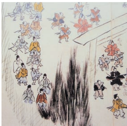
將軍御上使、鳥羽・稲垣藩主、造宮奉行（岩出末純画『豊受大神宮寛政御遷宮絵巻』）

敵かな御声の響きわたるなか、白絹に囲まれた神霊がゆかしく渡りゆく有様は、この世のものと想われない厳肅さに満ちている。新たな神威の出現と仰ぐべき一瞬の盛儀に、大勢の人びとはいとど感涙を止めかねたことであろう。