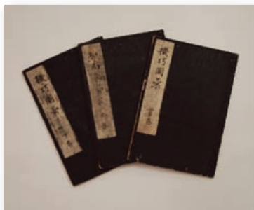
細川半蔵著『機巧図彙』三巻