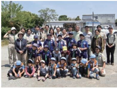
▲ 平塚のビーバー隊と記念撮影

カブ隊で、五月十三日に究極の野外科理をテーマに平塚第四・五・六団のビーバー隊（低学年）十名と一緒に活動をしました。今回は、燻製とパームクレーン作り挑戦しました。パームクレーンには竹の棒に付けて焼くのに悪戦苦闘しつつも、出来上がった時はスカウト皆充実感に溢れていました。