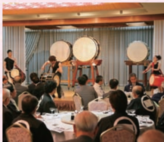
和太鼓「うるき」演奏