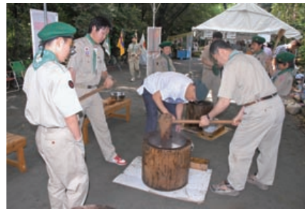
▲ リーダーが餅つきの手本をみせる

毎年三日に行われているもちつき大会ですが、本年は天候に恵まれず一日順延し四日の開催となりました。四日も生憎、今にも泣き出しそうな雲が天を覆い、全員で「雨よ降るな」と祈りましたが願いは届かず、時折大雨が降る中での活動となってしまいました。しかし我らがスカウトはキャンプ等で雨には慣れっことです。場所を素早く移動