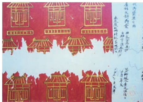
屋形紋 (承安元年御装束絵巻物)

点、御神宝が一八九種・四九一点に及ぶことが知られる。しかしながらそれら分類は、明快に分けがたい憾みがある。例えば御鏡について、内宮以下の別宮では御装束であるが、外宮以下では神宝とされており、必ずしも区分がたい。