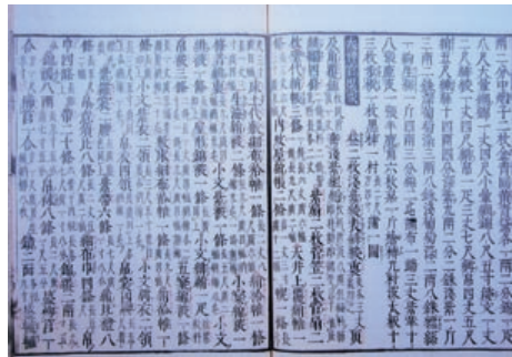
大神宮装束 (延喜式)