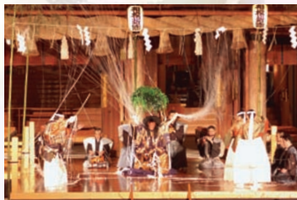
第四十二回写真展 宮司賞「相模新能 土蜘蛛」