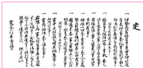
遷宮御条目（神宮文庫所蔵）

老中支配に属する造宮奉行は、伊勢町奉行とも別称し、造営事業を統督した。諸祭経費を上申し、造営料を捻出するため新田開発にも着手したという。御用材は御三家のうち、尾張・紀州の両藩に負担させたが、次第に河川の安定した尾張藩の木曾山に落ち着くことになった。作事小屋から遷御列の警固など、一切の守衛は津の藤堂藩や鳥羽の稲垣藩が担当する。また既述したように、御用材の搬入には伊勢周辺の神領民が奉仕した。こうして幕府から住民に至るまで、伊勢の式年遷宮に協力する体制が整っていったのである。