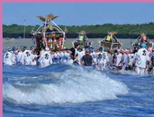
第56回神社本庁統理賞「祓祓」