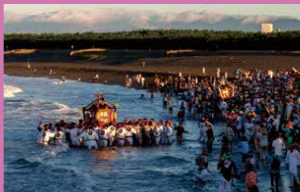
第56回寒川神社宮司賞「夜明けの祭典」