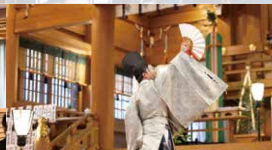
祈年祭並田打舞神事