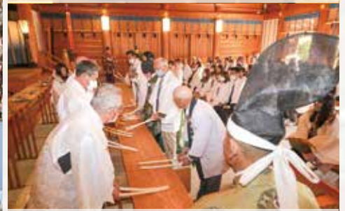
追難板を打ち鳴らす