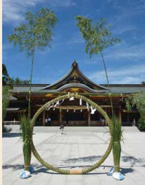
水無月大祓式並茅の輪神事

1日～15日 第54回学齡児図画展 6日・7日 年参講大祭 7日 午前10時 宮山年参講大祭 並衛生祈禱祭 29日 午前8時30分 昭和祭