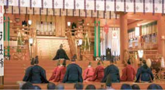
祈年祭並田打舞神事